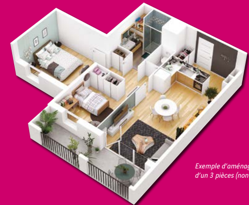
Exemple d'aménagement d'un 3 pièces (non contractuel)