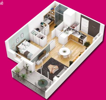
Exemple d'aménagement d'un 2 pièces (non contractuel)